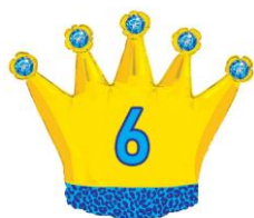
Hadzera (K3) Bedrija (L1) Siebe (L1)