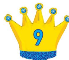
Tymur (Nimo 1) Nola (Nimo 2) Zahra (Nimo 2) Maxine (Baxo 1)